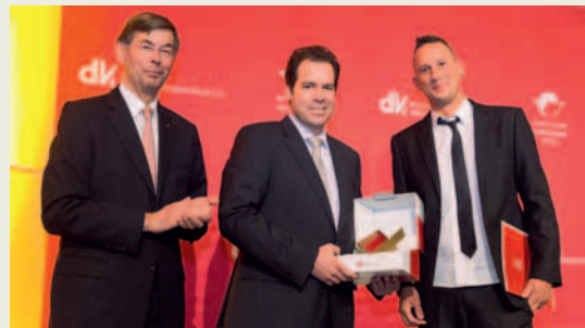
Bei der Preisübergabe des DVI im Herbst 2015 in Nürnberg.

Der Erfolg des Aufstellers und seines materialsparenden Designkonzepts gibt der Entscheidung der Model AG für den Topliner „Fusion“ recht. So konnte das Evian-Display den Juroren des DVI Deutschen Verpackungsinstitut den Deutschen Verpackungspreis 2015 in der Kategorie „Display und Promotionsverpackungen“ abringen. „Die ressourcenschonende Nutzung der Materialien und die clevere technische Umsetzung mit 100% Wellkarton lassen das Display kompakt und formschön am POS erscheinen“, hieß es.